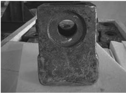
ハンマーヘッド(肉盛品)